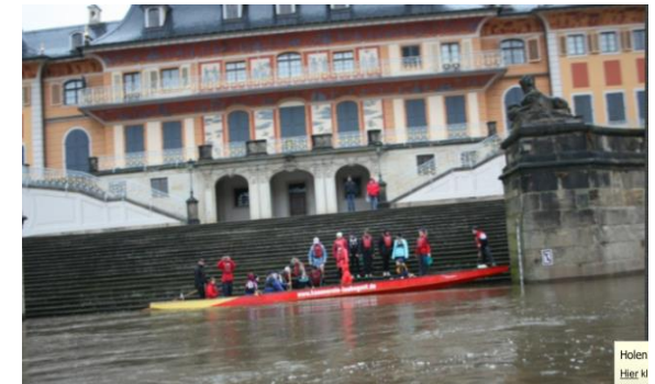
Traditionelles Neujahrsanpaddeln nach Pillnitz

Jährlich nehmen wir an 2 – 3 sportlichen Wettkämpfen/Trainingslagern teil.