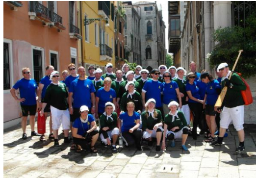
Drachenbootsportler des KVL in Venedig

Wir beteiligen uns aktiv am Vereinsleben.