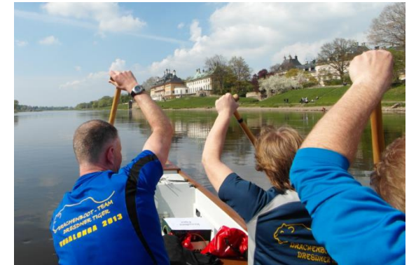
Tiger auf der Elbe bei Pillnitz

Jährlich nehmen wir an 2 – 3 sportlichen Wettkämpfen/Trainingslagern teil.